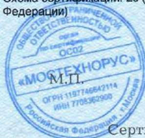
Схема сертификации: 2с (ГОСТ Р 53603-2020 Оценка соответствия. Схемы сертификации продукции в Российской Федерации)